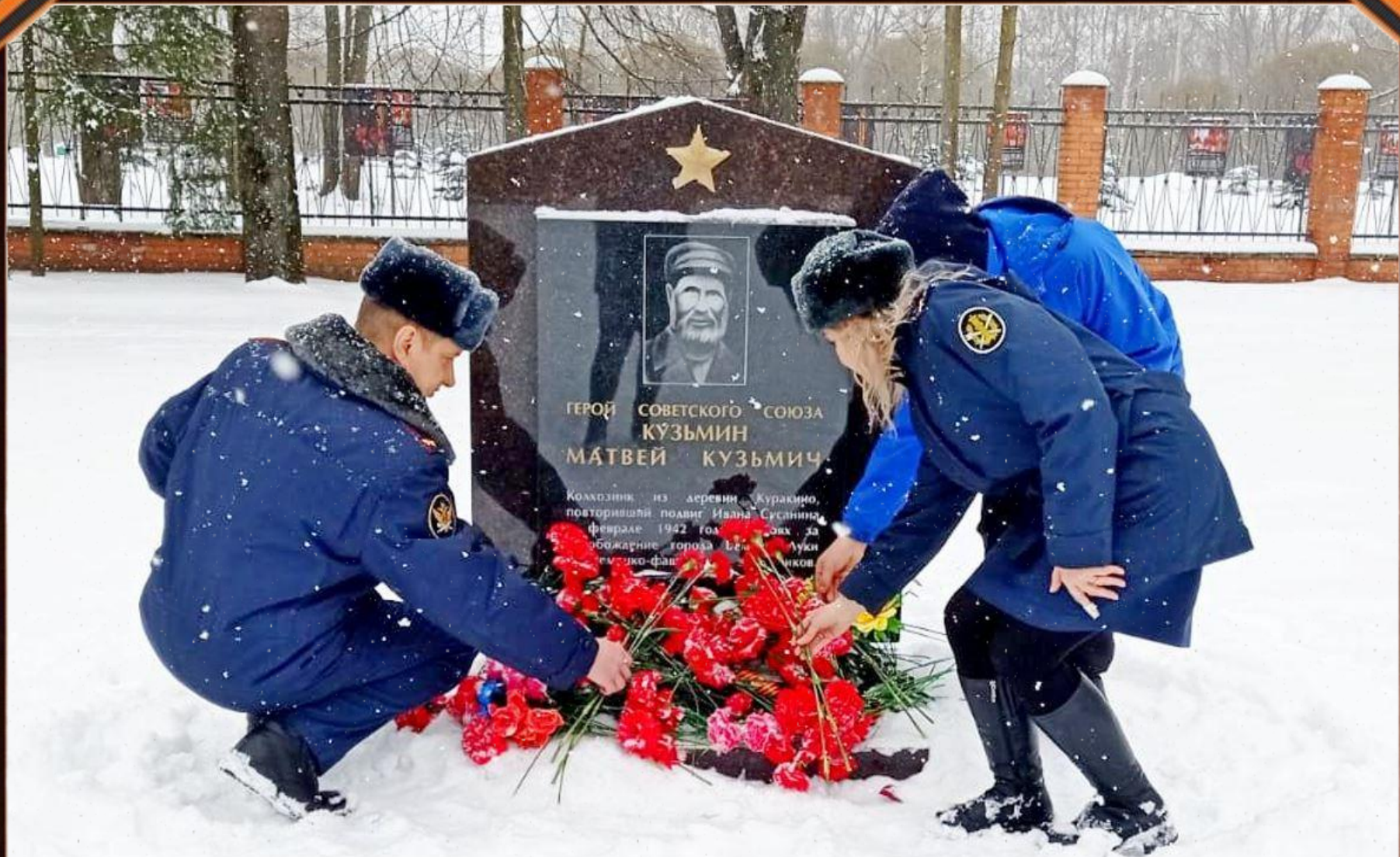
Место захоронения Героя Советского Союза Матвея Кузьмина в г. Великие Луки.