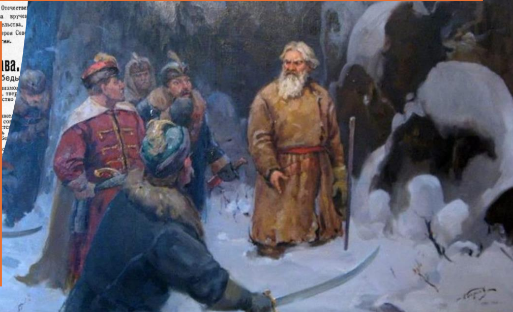
На снимке: пионеры и школьники Золотковской средней школы волагают венки на братскую могилу павших воинов.

и был этим убит черонок. 4 прик Шла во, II Стри Албай Кома в 14 свете баталу М. Лука.