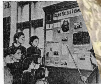
НА СНИМКЕ: группа учащихся Лычачевской восьмилетней школы у стенда, посвященного подвигу Матвея Кузьмина.